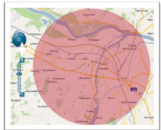
Zielgruppenselektion per Umkreissuche